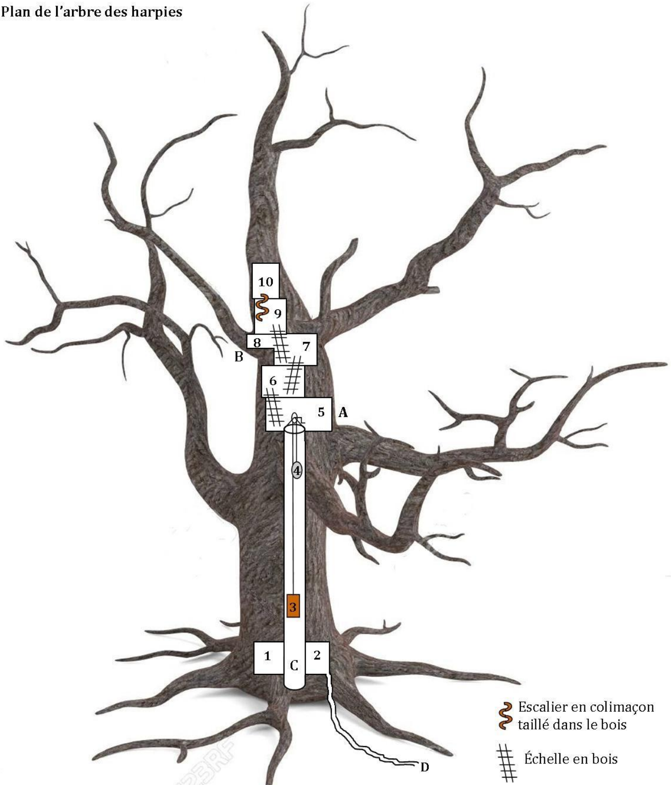
Plan de l'arbre des harpies

1) Prison : grande cellule unique avec une porte renforcée en chêne dans laquelle se trouvent Trab', Ketyan et Solandali.