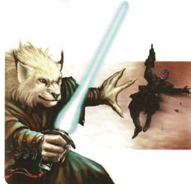
Un Jedi Cathar utilise Draw Closer sur un Assassin Sith.

Spécial : Vous pouvez utiliser un point de Force pour traité l'attaquant comme étant pris au dépourvu vis-à-vis de votre attaque au sabrelaser.