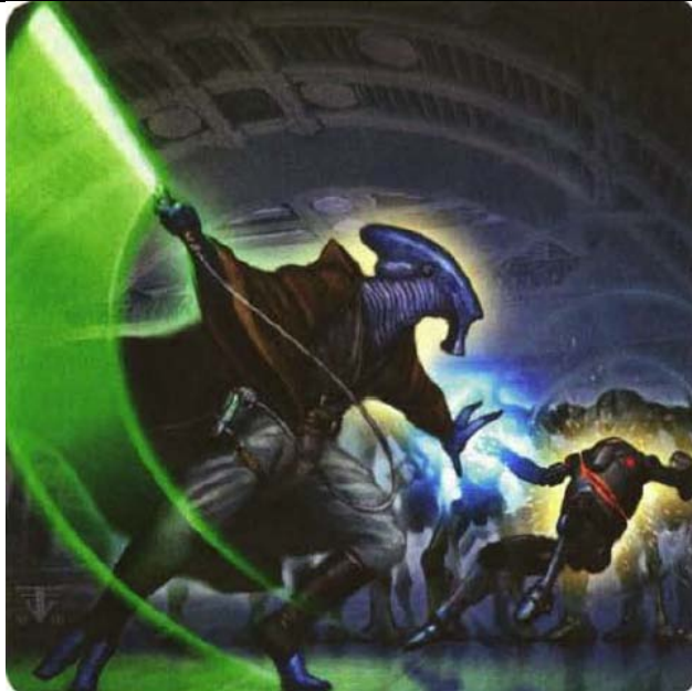
Un Jedi Selkath utilise un Pushing Slash.

Spécial : Vous pouvez utiliser deux sabrelasers pour utiliser ce pouvoir. Vous pouvez dépenser un point de Force pour effectuer +1d6 point de dégâts à chaque cible que vous touchez.